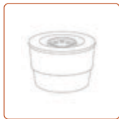
Холдер для молотого кофе