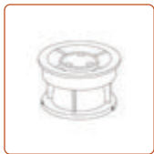
Холдер для капсулы