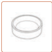
Нольцо для темперовки