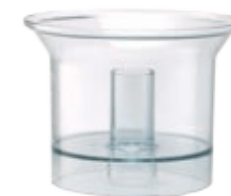
Малая чаша объемом 600 мл