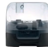
Контейнер для хранения насадок