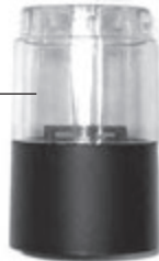
Стакан для специй