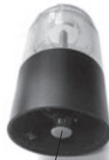
Винт для регулировки степени помола