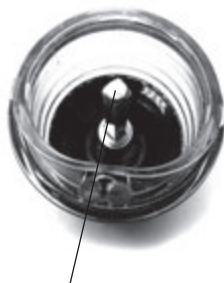
Ось стакана для специй