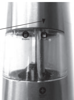
Указатель положения моторного блока