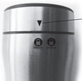
Указатель положения крышки