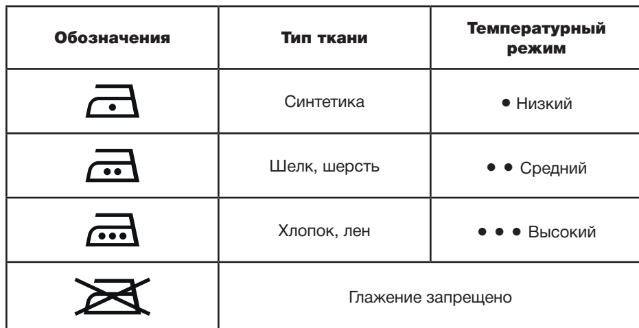
Таблица может быть использована только для гладких тканей. Если на ткани присутствует рельеф, оборки, нашивки и прочие декоративные элементы, рекомендовано производить глажение при низких температурах.

Перед началом работы изучите информацию о допустимых режимах глажения на ярлыке изделия. В случае если ярлык с рекомендациями отсутствует, но известен материал изделия, обратитесь к таблице.