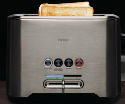
ТОСТЕР T702 РУКОВОДСТВО ПОЛЬЗОВАТЕЛЯ