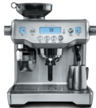
КОФЕЙНАЯ СТАНЦИЯ С805